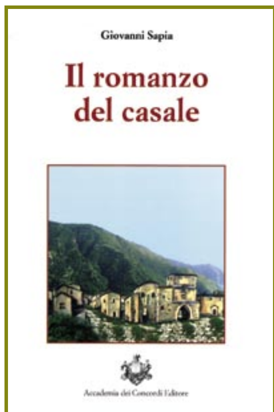
Giovanni Sapia Il romanzo del casale ISBN 978/88/90681905