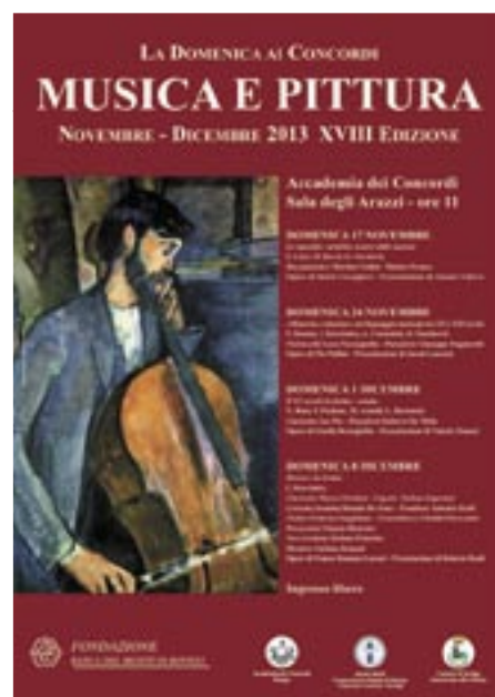
Novembre - Dicembre Ciclo “Musica e Pittura” A cura di Accademia dei Concordi, Conservatorio “F. Venezze”, Fondazione Banca del Monte di Rovigo