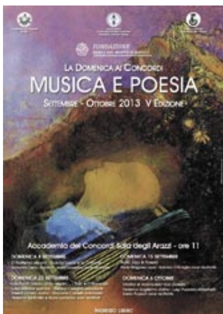
Settembre - Ottobre Ciclo “Musica e Poesia” A cura di Accademia dei Concordi, Conservatorio “F. Venezze”, Fondazione Banca del Monte di Rovigo