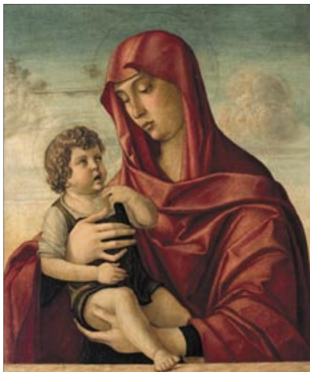
Pinacoteca dell'Accademia dei Concordi e del Seminario Vescovile di Rovigo I capolavori ISBN 978-88-906819-8-1